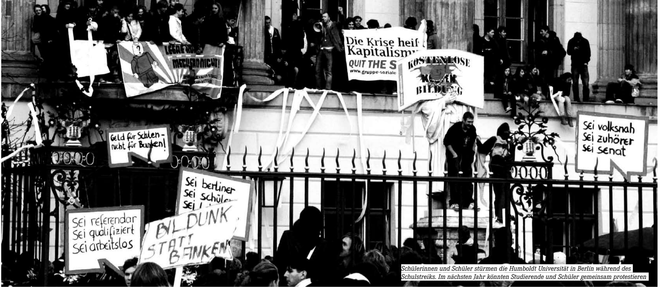
Schülerinnen und Schüler stürmen die Humboldt Universität in Berlin während des Schulstreiks. Im nächsten Jahr könnten Studierende und Schüler gemeinsam protestieren

Der Schülerstreik am 12. November übertraf alle Erwartungen. Nächstes Jahr könnte eine gemeinsame Bildungsbewegung von Studierenden und Schülern entstehen