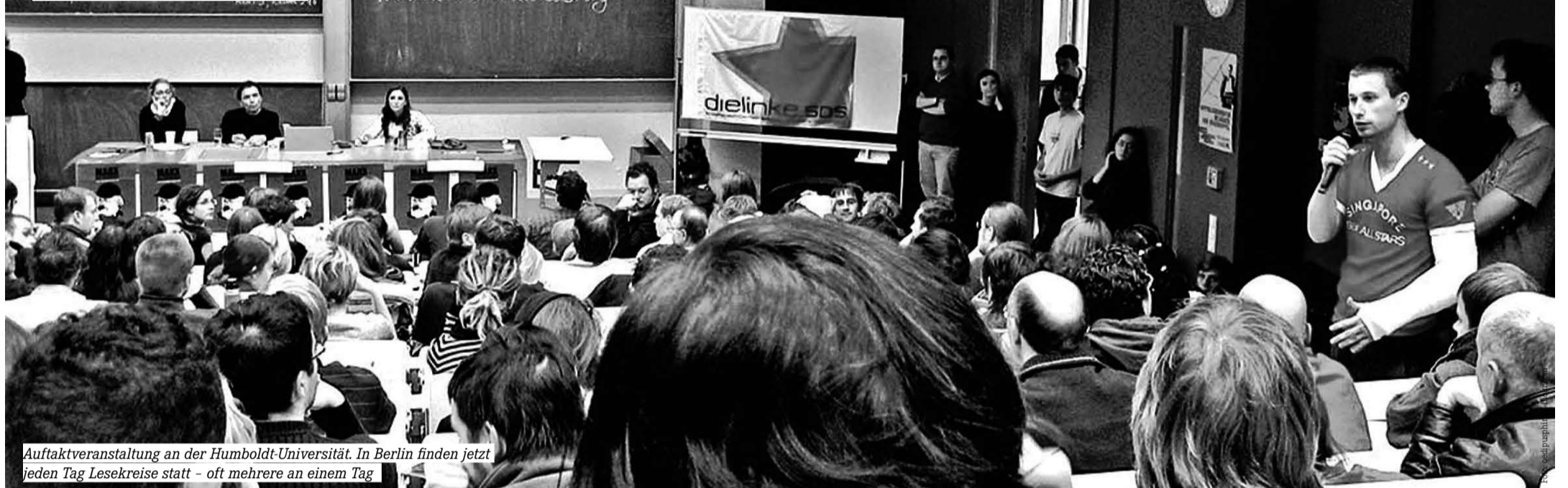
Auftaktveranstaltung an der Humboldt-Universität. In Berlin finden jetzt jeden Tag Lesekreise statt - oft mehrere an einem Tag

★ Um die Lesekreise miteinander zu vernetzen, ist die Kapital-Lesebewegung auf Spenden angewiesen: Mehr unter www.kapital-lesen.de