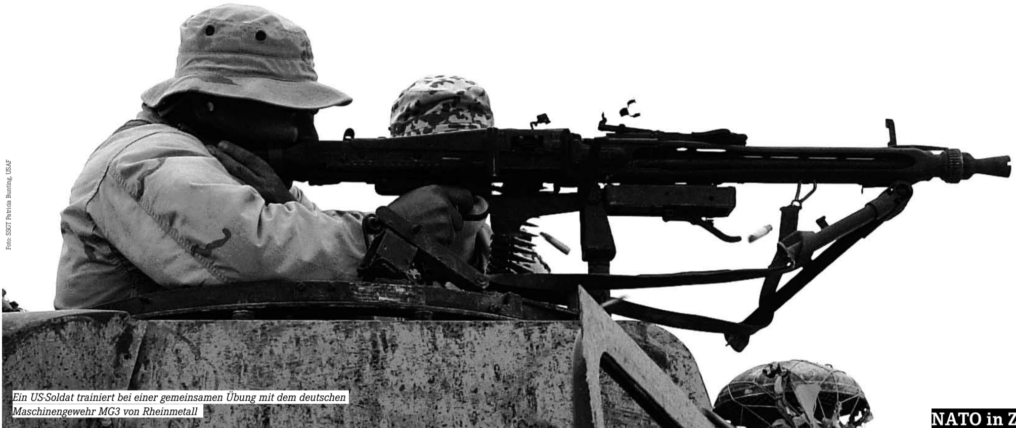
Ein US-Soldat trainiert bei einer gemeinsamen Übung mit dem deutschen Maschinengewehr MG3 von Rheinmetall